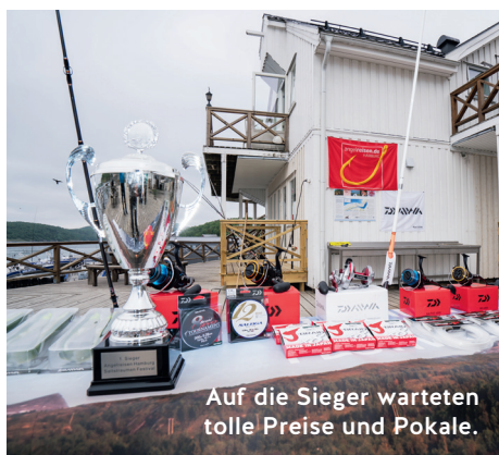
Auf die Sieger warteten tolle Preise und Pokale.

außerhalb des Saltfjordes, die fischreichen Schärenketten vorm Bodøer Flughafen, die Insel Landegode oder die Schären vor Bliksvær. Selbst, wenn schlechtes Wetter und zu viel Wind herrschen würden, dieses Revier hat immer eine anglerische Alternative parat: Am Eingang des benachbarten Skjerstadfjordes, in einigen kleineren Buchten des Saltfjordes und im Indre Sundan ist das Angeln auch bei viel Wind möglich. Dort beißen neben Dorschen, Köhlern und Heilbutt vor allen