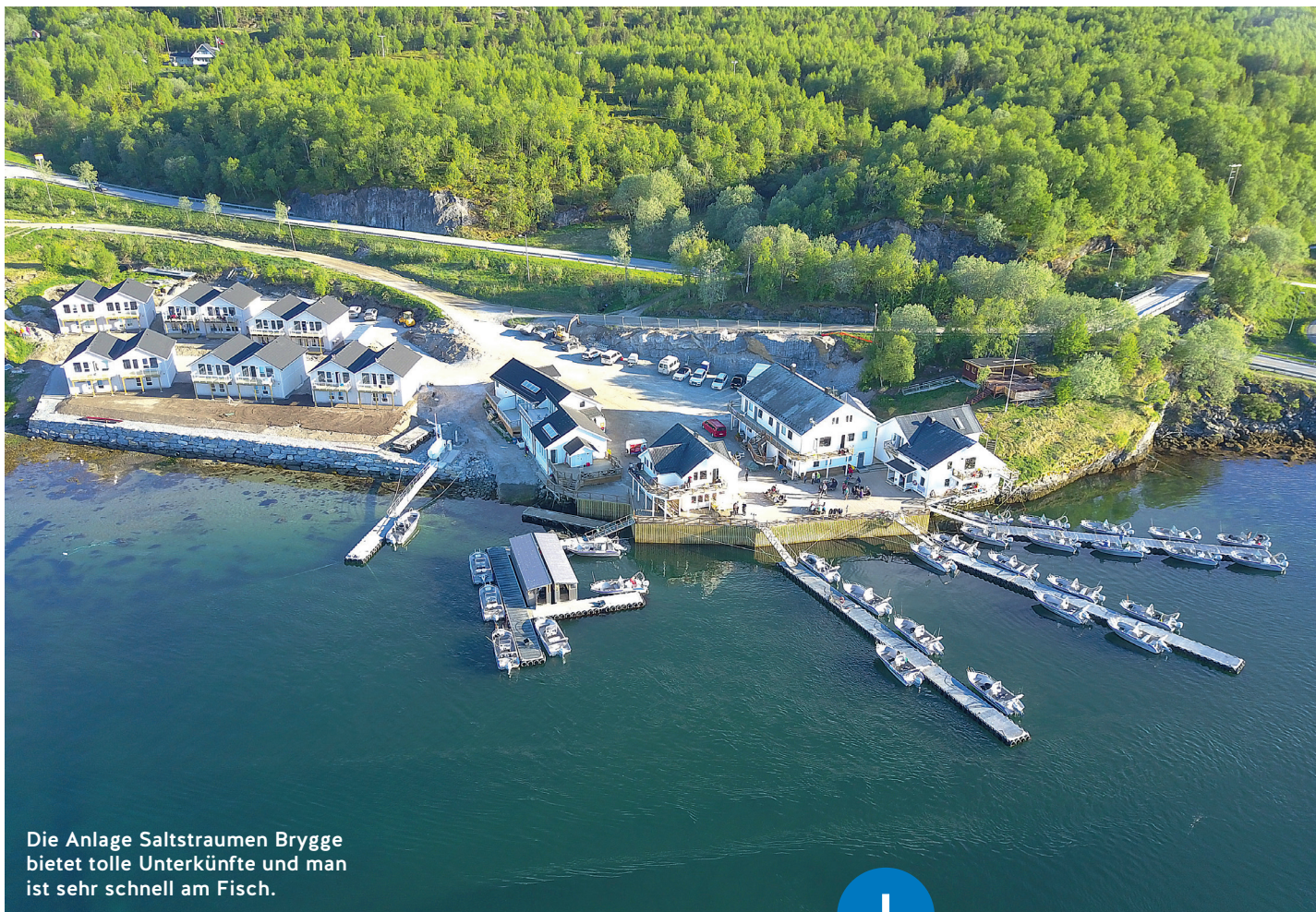
Die Anlage Saltstraumen Brygge bietet tolle Unterkünfte und man ist sehr schnell am Fisch.

außerhalb des Saltfjordes, die fischreichen Schärenketten vorm Bodøer Flughafen, die Insel Landegode oder die Schären vor Bliksvær. Selbst, wenn schlechtes Wetter und zu viel Wind herrschen würden, dieses Revier hat immer eine anglerische Alternative parat: Am Eingang des benachbarten Skjerstadfjordes, in einigen kleineren Buchten des Saltfjordes und im Indre Sundan ist das Angeln auch bei viel Wind möglich. Dort beißen neben Dorschen, Köhlern und Heilbutt vor allen